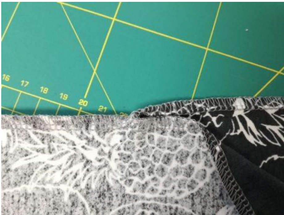
16. Detail začistění