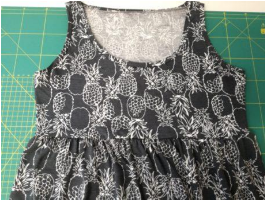
25. Našitá sukně