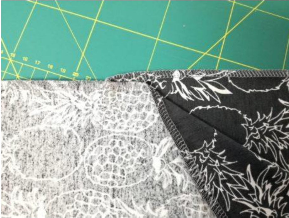
15. Kraje rozparku začistěte