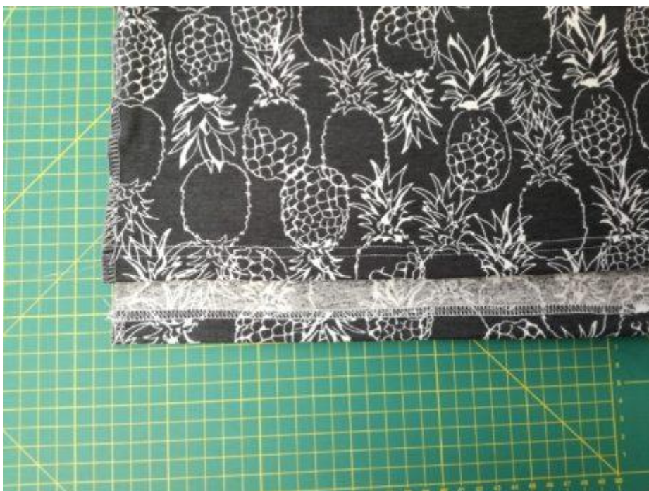
26. Dolní kraj šatů zažehlete 2 cm do RS a prošijte na coverlocku nebo dvojehlou, overlockovým stehem, nebo trojkrokovým cikcakem, dle možností.